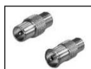
Adapter F-IEC mannelijk F-IEC vrouwelijk